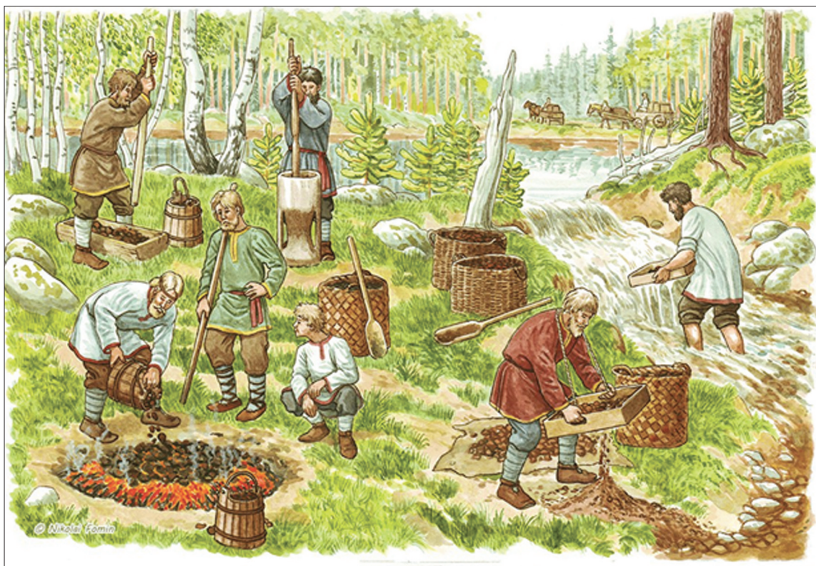
Так добывали коричневые руды и выплавляли металл первые металлурги.

К 1630 году рядом с месторождением были поставлены амбары и поселены работные люди, которым предписывалось сдать к началу мая 400 пудов железа. В то время для плавки руды использовался сыродутный способ производства железа. Сам завод состоял из плавильного амбара с двумя печами-домницами для плавки железа. При нагревании руда превращалась в вязкую массу, включавшую в себя шлак и уголь. Полученное сыродутное железо проковывалось молотом и очищалось от примесей. Здесь же, при заводе, помимо плавильного амбара, находились кузница с двумя горнами для проковки криц и изготовления продукции, изба для отдыха работников, так как «варка» могла продолжаться сутками, амбар для хранения ин-